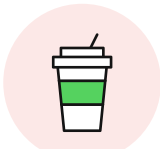
프랜차이즈 직영 매장