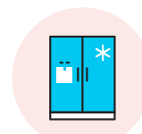
대형 전자판매점 직영 매장