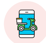
대형 배달앱 등

* 다만, 배달앱으로 주문하더라도 지역사랑상품권 가맹점의 자체 단말기를 사용하여 현장에서 결제하는 경우 국민지원금 사용이 가능합니다.