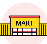
대형마트, 기업형 슈퍼마켓